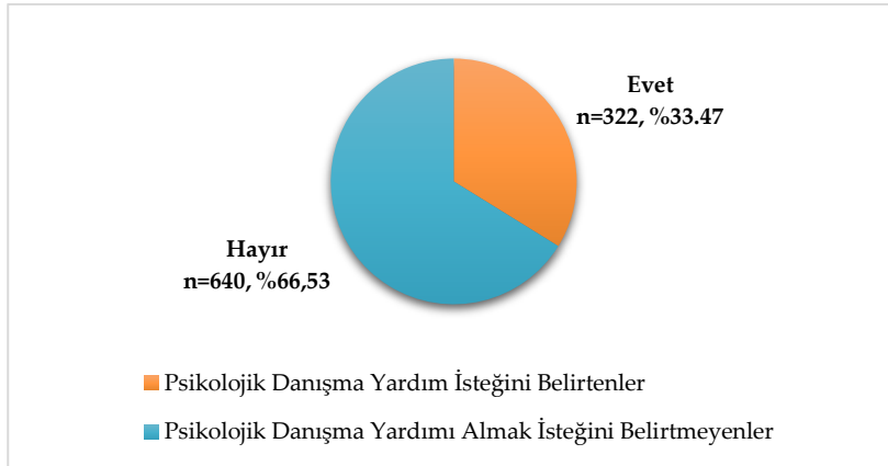
Şekil 1. Psikolojik danışma teklifine verilen cevaplar

Psikolojik yardım teklifini kabul eden üniversite öğrencilerinin psikolojik yardım alma davranışları incelendiğinde, örnekleme alınan 962 öğrenciden 322’sinin (%33,47), veri toplama araçlarında yer alan yardım teklifi kısmına “psikolojik danışma yardımı almak istiyorum” şeklinde işaretleme yaptığı anlaşılmıştır. Psikolojik danışma yardımına ihtiyaç duymayanların sayısı ise 640’tır (%66,53) (Şekil 1).